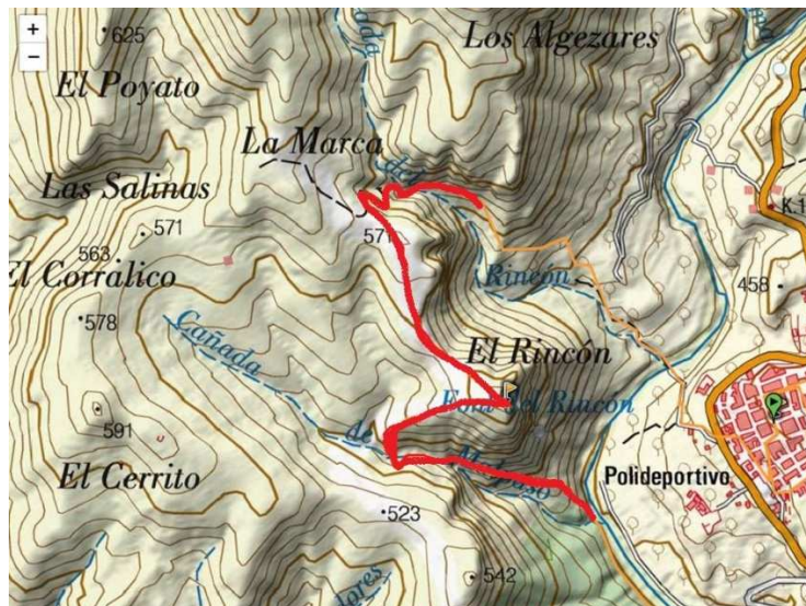
Plano zona militar cerro el rincon y malpaso